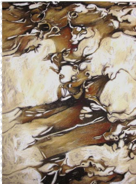
Aufsteigende Form II, 2009, 50 cm x 70 cm