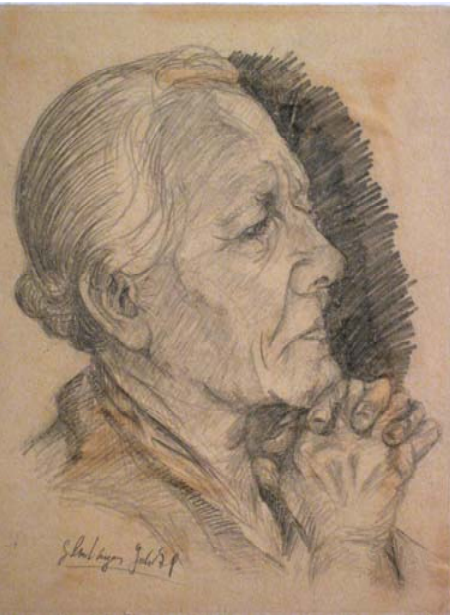
Bildnis einer alten Frau, 1979, 17 cm x 22 cm